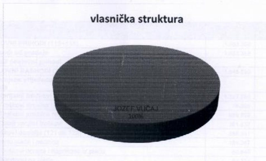
Vlasnička struktura prije i nakon mjera restrukturiranja

Obrt je 100% u privatnom vlasništvu, a vlasnik obrta je Jozef Vučaj, OIB: 15655072812, Varaždin, Andrije Kačića Miošića 6. Nakon restrukturiranja vlasnička struktura obrta neće se mijenjati. U nastavku se nalazi grafički prikaz vlasničke strukture prije i nakon mjera restrukturiranja.